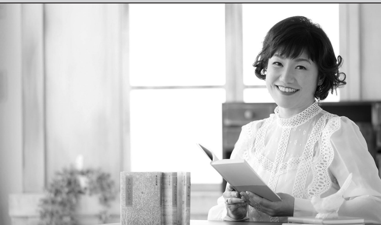
金子みすゞを歌って20周年