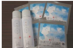
⑦湯田温泉旅館協同組合

ゆだうるるミスト、ゆだうるるフェイスマスク、ゆだうるるリップスティックゆう太・ゆう子グッズご朱印帳(限定3セット)