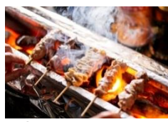
⑬株式会社ベアーズコーポレーション