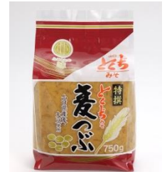
⑩とくち味噌株式会社

ごま油、黒ごま油、ごまドレッシング、えごま油ごまポン酢、ごまのおからごまふりかけ