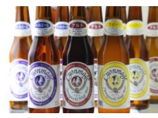
⑭株式会社岸田商会

チョンマゲビール(樽生)チョンマゲビール(瓶)本だいたいしぼり酢、味付ポン酢 味兆など