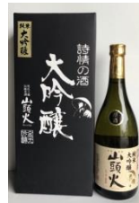
⑧金光酒造株式会社

ゆだうるるミスト、ゆだうるるフェイスマスク、ゆだうるるリップスティックゆう太・ゆう子グッズご朱印帳(限定3セット)