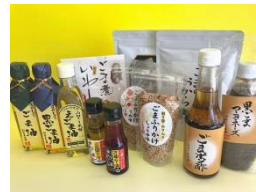
⑨有限会社クレアツワン山口ごま本舗

ごま油、黒ごま油、ごまドレッシング、えごま油ごまポン酢、ごまのおからごまふりかけ