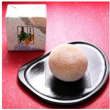
⑪おいでませ山口館