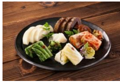
②うまもん株式会社