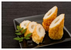
⑫防府観光物産協会