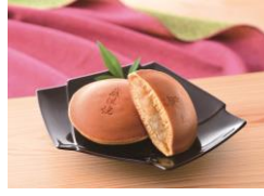
③下関市産業振興課